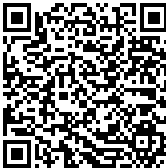
Leia a matéria completa. Acesso pelo QRCode.