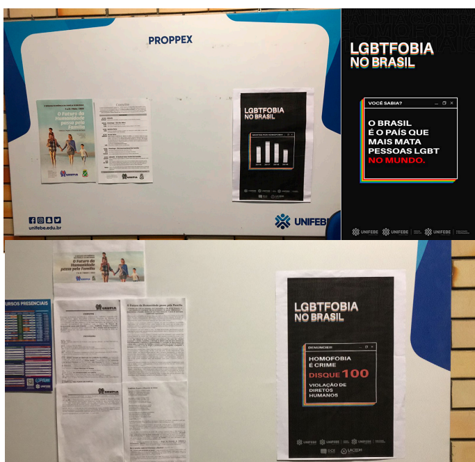
Cartazes colados nos murais da UNIFEBE.