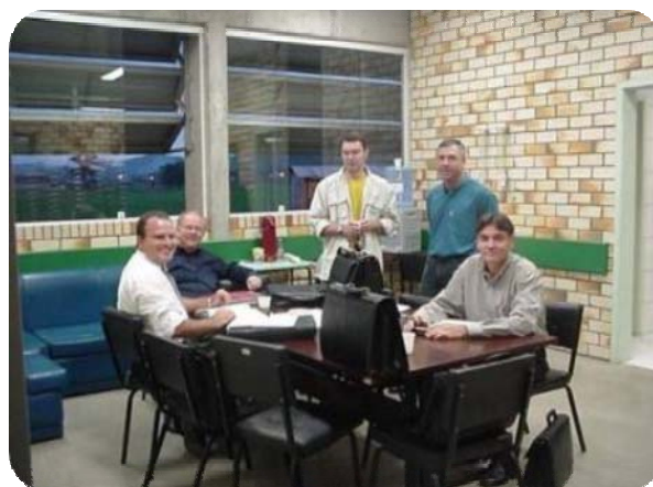
IMAGENS DA SALA DOS PROFESSORES