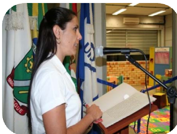
IMAGENS DA INAUGURAÇÃO DA BIBLIOTECA INFANTIL DA UNIFEBE