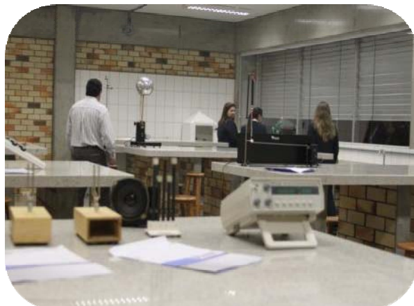
IMAGENS DOS LABORATÓRIOS DO BLOCO D