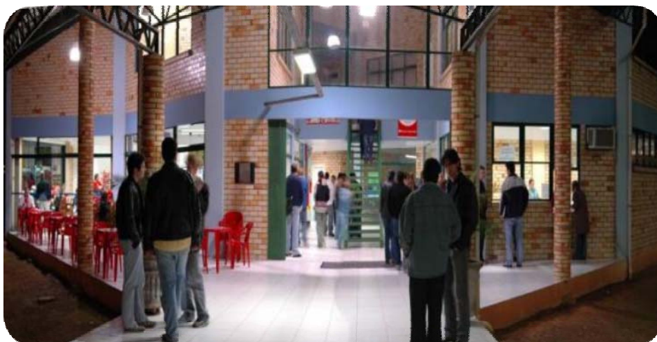
IMAGEM FRONTAL DO CENTRO DE CONVIVÊNCIA – BLOCO B

Com 1.050 m 2 , esse bloco abriga o Diretório Central dos Estudantes, a Lanchonete, a Livraria, um setor de Fotocópias, a Assessoria de Comunicação Social, a Pró-Reitoria de Administração (Proad), a Contabilidade, o Financeiro, o setor de Serviços Gerais e o setor de Suprimentos.