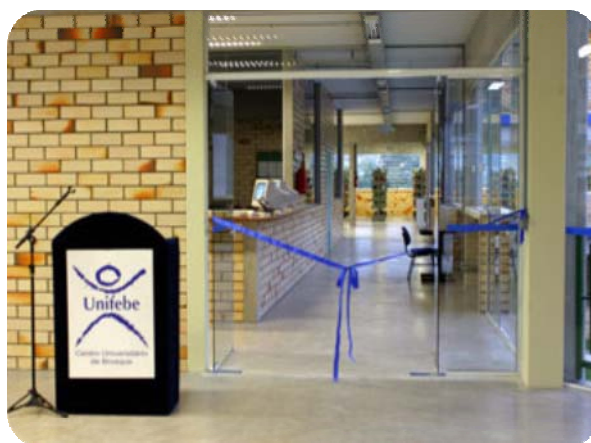
IMAGEM DA ÁREA DE ACESSO A BIBLIOTECA

Em 23 de fevereiro de 2005 a Biblioteca Acadêmica inaugurou seu novo espaço físico, localizado no segundo piso do Bloco C.