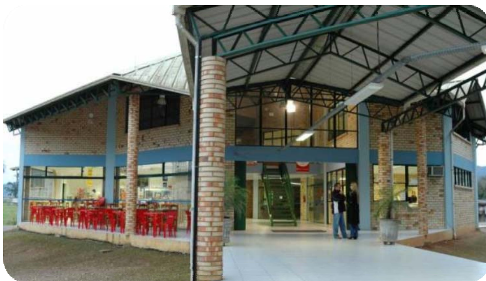
IMAGEM FRONTAL DO CENTRO DE CONVIVÊNCIA – BLOCO B

Em primeiro de agosto de 2002 foi inaugurado o Bloco de Convivência, também conhecido como Bloco B.