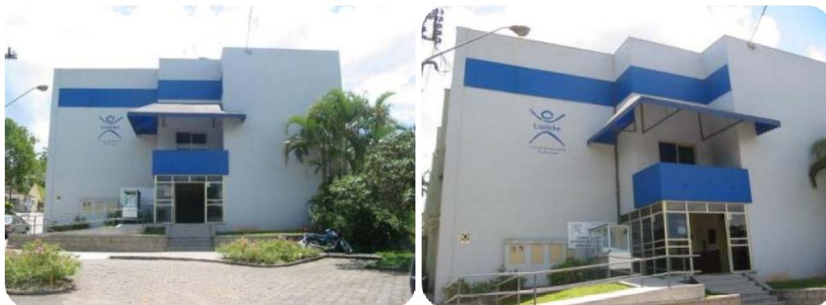
IMAGENS EXTERNAS DO ANFITEATRO DA UNIFEBE

O prédio do Anfiteatro é o primeiro imóvel próprio adquirido pela mantenedora da Unifebe. Inaugurado no dia 30 de abril de 1987, mede 1.442 m 2 (mil quatrocentos e quarenta e dois metros quadrados) e localiza-se à Rua Manuel Tavares, n° 52, no centro da cidade de Brusque. Nesse prédio encontram-se cinco salas de aula, uma sala de audiências e várias salas menores ocupadas pelo Núcleo de Prática Jurídica, banheiros e um auditório equipado com luz, som, palco com dois camarins e espaço na platéia para 450 pessoas sentadas.