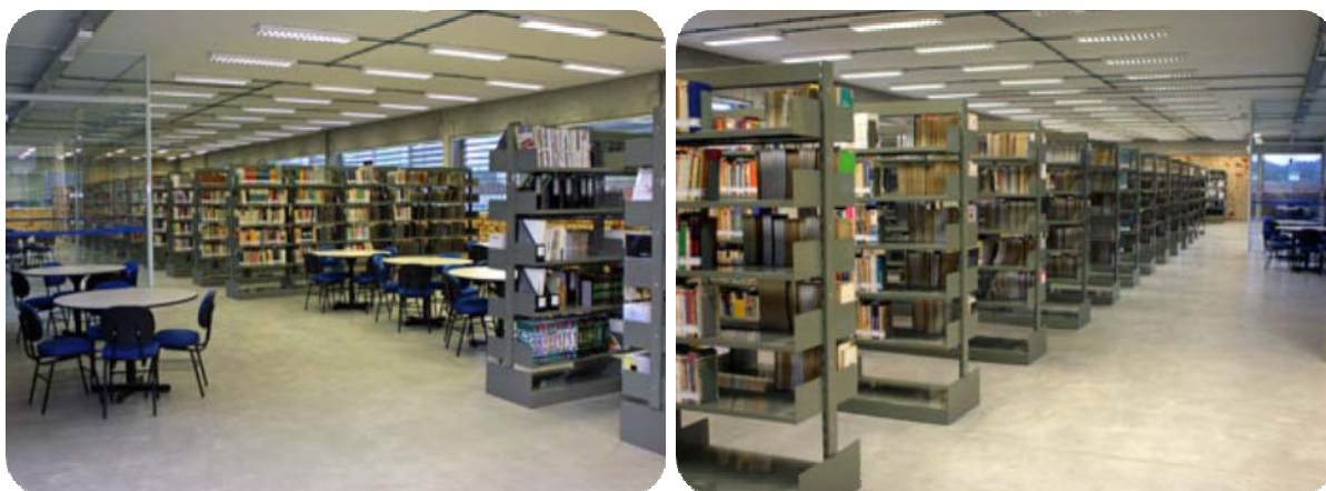
IMAGEM DA BIBLIOTECA ACADÊMICA