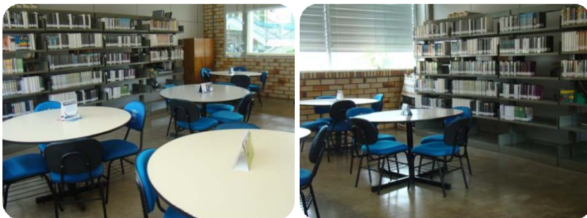
IMAGENS DA SALA DE TRABALHO DOCENTE

No local além das mesas de trabalho, também estão disponíveis dois computadores com acesso a internet, para auxiliar nos trabalhos.