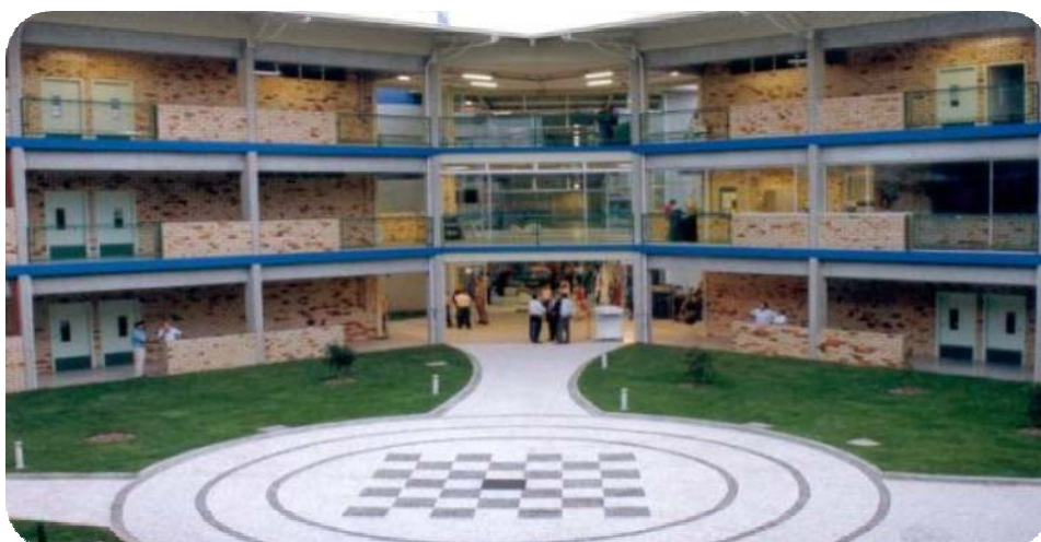
IMAGEM DO PÁTIO DO BLOCO C

O Bloco C da Unifebe teve sua obra iniciada em 29 de junho de 2004, e foi inaugurado em 23 de fevereiro de 2005.