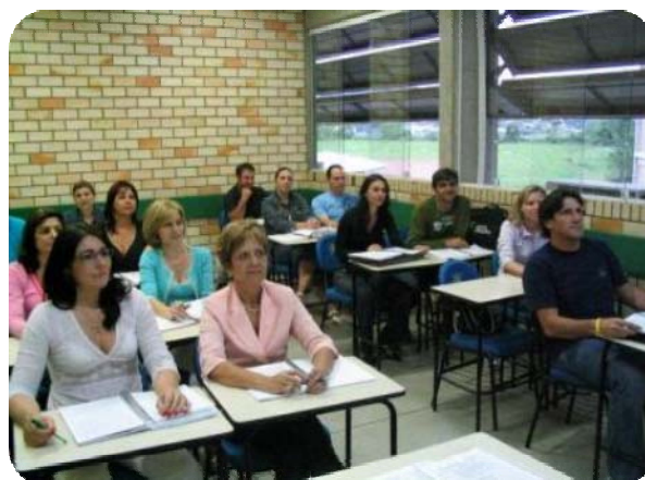
IMAGENS DAS SALAS DE AULA

Ainda nesse mesmo bloco, de 5,4 mil metros quadrados, estão funcionando a Secretaria Acadêmica, o setor de Recursos Humanos, o Núcleo de Informática, a Assessoria Jurídica e a Reitoria.