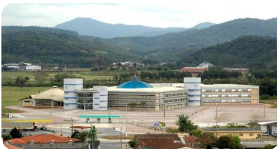
IMAGEM DO CAMPUS DA UNIFEBE LOCALIZADO NO BAIRRO SANTA TEREZINHA