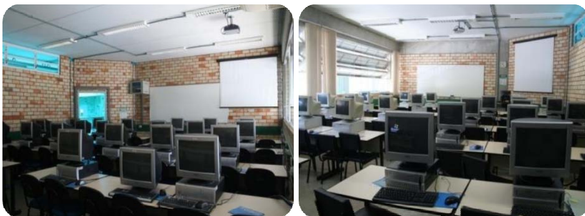
IMAGENS DOS LABORATÓRIOS DE INFORMÁTICA DA UNIFEBE

Excetuando-se os horários de aulas, todos estão abertos gratuitamente aos acadêmicos e professores para elaboração de trabalhos escolares, monografias, teses e trabalhos de conclusão de cursos, bem como acesso à navegação na web.