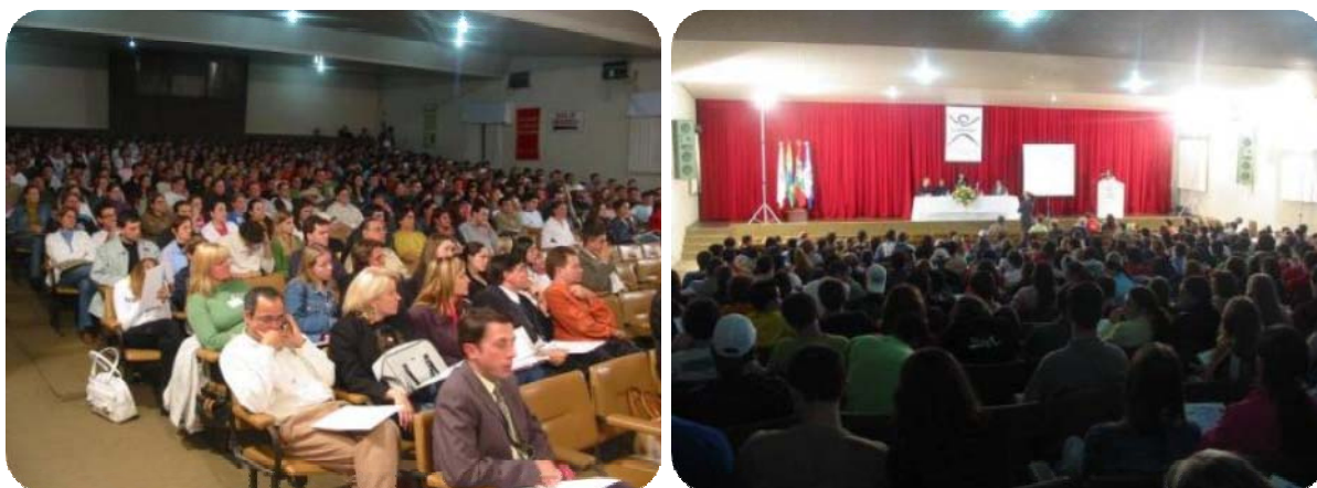
IMAGENS INTERNAS DO ANFITEATRO DA UNIFEBE