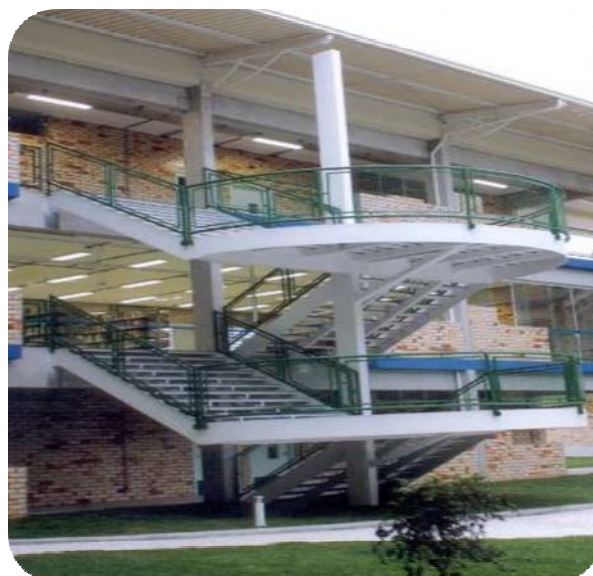
IMAGENS DO BLOCO C

Com uma área construída de 4.363,82 m 2 , o prédio abriga a Biblioteca Acadêmica com 1.077,51 m 2 , onde também funciona a Biblioteca Infantil, e um auditório com 153,66 m 2 para comportar 130 pessoas e 30 salas de aula que são utilizados no período noturno e matutino pelos cursos de graduação e pós-graduação.