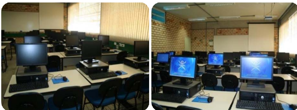
IMAGENS DOS LABORATÓRIOS DE INFORMÁTICA DA UNIFEBE

A Unifebe possui quatro Laboratórios de Informática. O primeiro foi implantado em maio de 1996, o segundo em fevereiro de 2003 e o terceiro em março de 2005. A implantação do quarto Laboratório de Informática ocorreu no segundo semestre de 2007.