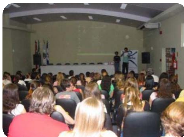
IMAGENS DO AUDITÓRIO DO BLOCO C

As salas de aula têm dimensões variando entre 43,87 m 2 e 77,96 m 2 . Além das salas de aula, funcionam neste bloco, duas salas destinadas à Secretaria das Coordenações e a Pró-Reitoria de Ensino de Graduação (Proeng), a Pró-Reitoria de