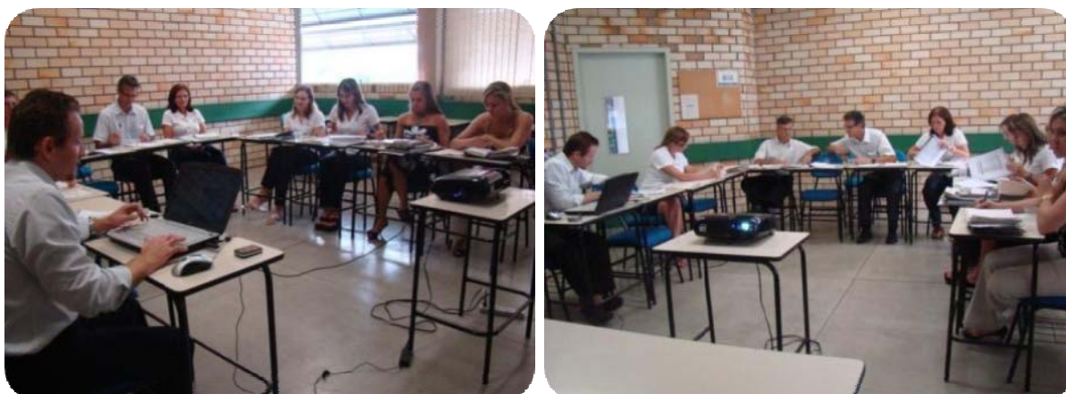
IMAGENS DA SALA DE REUNIÕES DO BLOCO A

Nela ocorrem as reuniões dos Conselhos da mantida (Unifebe) e da mantenedora (FEBE), além das reuniões dos colegiados de cursos, e outras reuniões de planejamento e gestão que se fazem necessárias.