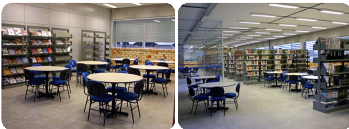
IMAGENS DAS MESAS PARA PESQUISA E LEITURA