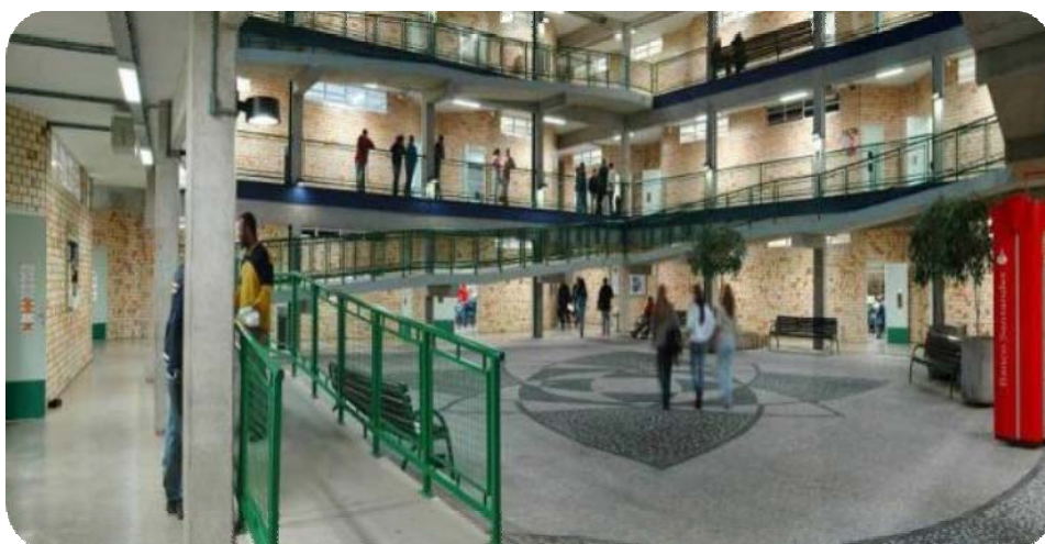
IMAGEM INTERNA DO BLOCO A

Em 03 de março de 2001 foi inaugurado o Bloco A do campus da Unifebe iniciado em setembro do ano 2000.