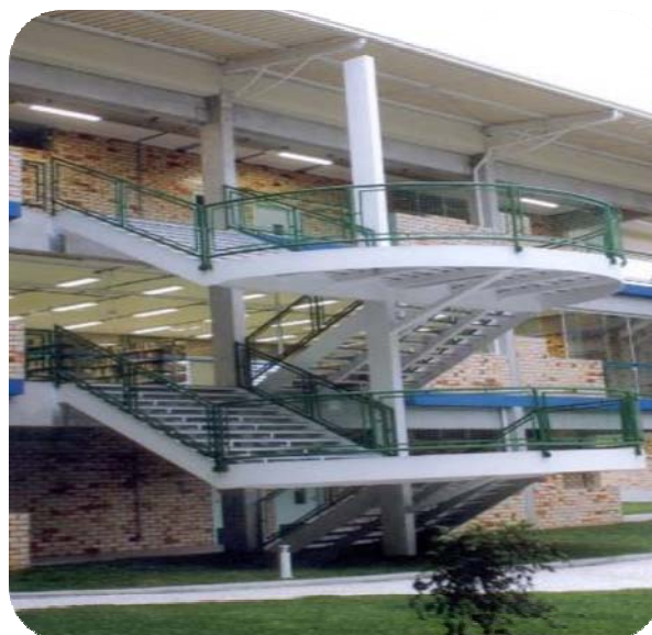
IMAGENS DO BLOCO C

Com uma área construída de 4.363,82 m 2 , o prédio abriga a Biblioteca Acadêmica com 1.077,51 m 2 , onde também funciona a Biblioteca Infantil, e um auditório com 153,66 m 2 para comportar 130 pessoas e 30 salas de aula que são