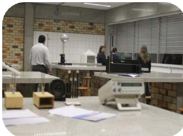
IMAGENS DOS LABORATÓRIOS DO BLOCO D