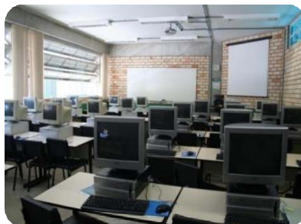
IMAGENS DOS LABORATÓRIOS DE INFORMÁTICA DA UNIFEBE

Excetuando-se os horários de aulas, todos estão abertos gratuitamente aos acadêmicos e professores para elaboração de trabalhos escolares, monografias, teses e trabalhos de conclusão de cursos, bem como acesso à navegação na web.