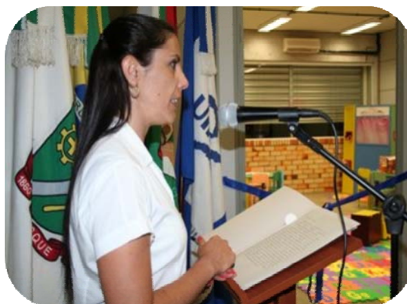
IMAGENS DA INAUGURAÇÃO DA BIBLIOTECA INFANTIL DA UNIFEBE