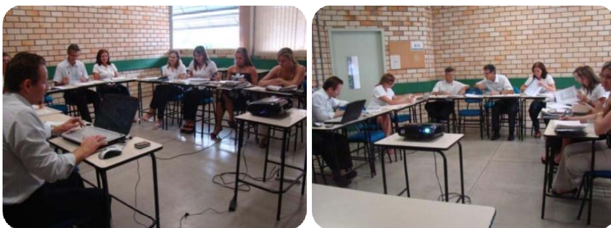
IMAGENS DA SALA DE REUNIÕES DO BLOCO A

Nela ocorrem as reuniões dos Conselhos da mantida (Unifebe) e da mantenedora (FEBE), além das reuniões dos colegiados de cursos, e outras reuniões de planejamento e gestão que se fazem necessárias.