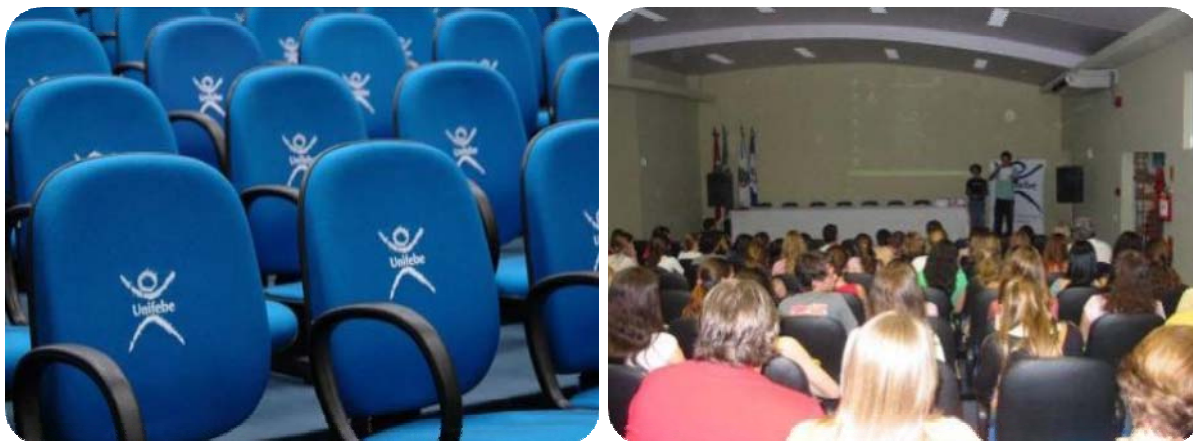
IMAGENS DO AUDITÓRIO DO BLOCO C

utilizados no período noturno e matutino pelos cursos de graduação e pós-graduação.