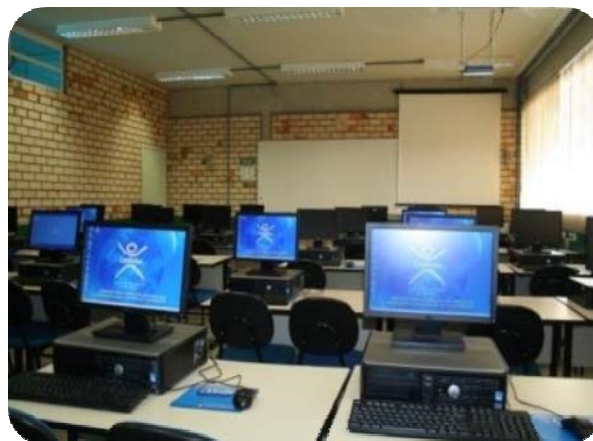
IMAGENS DOS LABORATÓRIOS DE INFORMÁTICA DA UNIFEBE