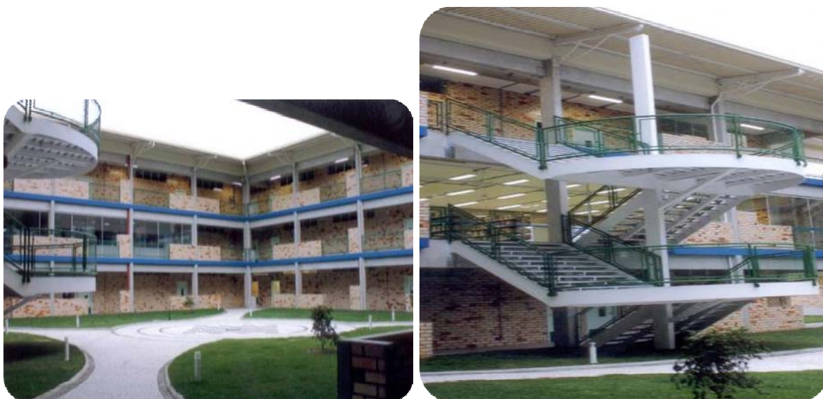
IMAGENS DO BLOCO C

Com uma área construída de 4.363,82 m 2 , o prédio abriga a Biblioteca Acadêmica com 1.077,51 m 2 , onde também funciona a Biblioteca Infantil, e um auditório com 153,66 m 2 para comportar 130 pessoas e 30 salas de aula que são