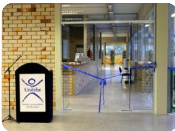
IMAGEM DA ÁREA DE ACESSO A BIBLIOTECA

Em 23 de fevereiro de 2005 a Biblioteca Acadêmica inaugurou seu novo espaço físico, localizado no segundo piso do Bloco C.