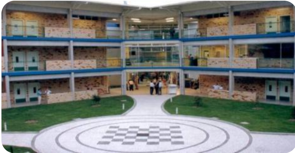
IMAGEM DO PÁTIO DO BLOCO C

O Bloco C da UNIFEBE teve sua obra iniciada em 29 de junho de 2004, e foi inaugurado em 23 de fevereiro de 2005.