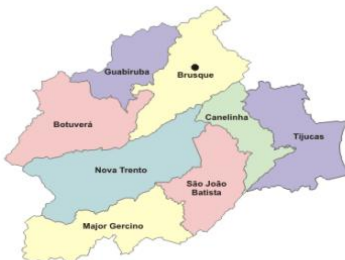
MAPA DOS MUNICÍPIOS QUE FAZEM PARTE DA ÁREA DE ABRANGÊNCIA DA SDR DE BRUSQUE

A área de abrangência da UNIFEBE inclui os municípios do Vale do Itajaí Mirim e Vale do Rio Tijucas, totalizando uma população de aproximadamente 211 mil habitantes. Situada entre a capital e o Nordeste do Estado, essa região apresenta vários atrativos como: as marcas na arquitetura em estilo enxaimel, a culinária, as festas típicas, a religiosidade, os jardins bem cuidados, o empreendedorismo e a força na indústria têxtil, heranças dos pioneiros germânicos, italianos e açorianos.