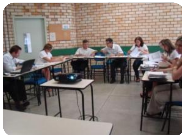
IMAGENS DA SALA DE REUNIÕES DO BLOCO A