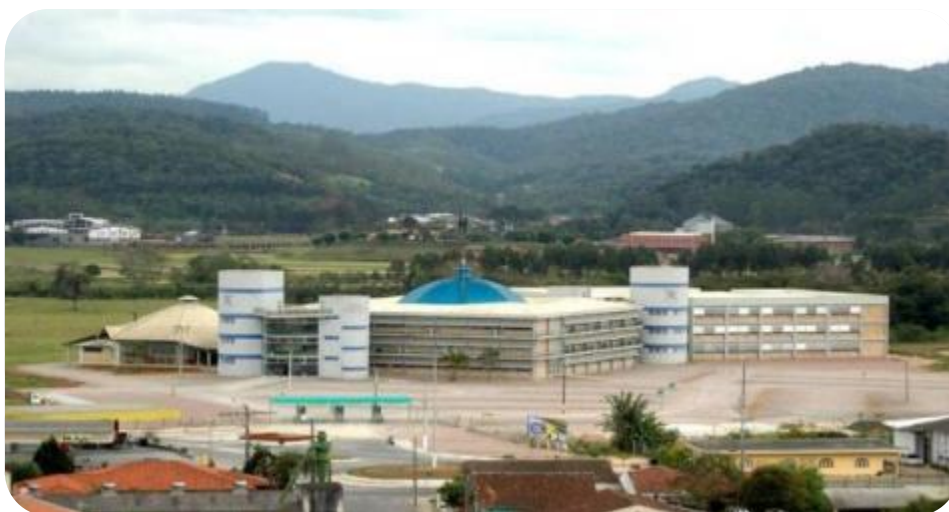
IMAGEM DO CAMPUS DA UNIFEBE LOCALIZADO NO BAIRRO SANTA TEREZINHA

O campus do Bairro Santa Teresinha, onde estão localizados os Blocos A, B, e C possui sistema de climatização em todas as suas salas de aula, auditório, Biblioteca Acadêmica, laboratórios e salas dos setores administrativos.