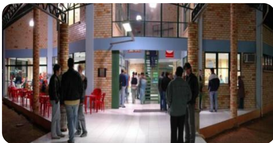
IMAGEM FRONTAL DO CENTRO DE CONVIVÊNCIA – BLOCO B

Com 1.050 m 2 , esse bloco abriga uma Lanchonete, a Livraria, o setor de Fotocópias, a Assessoria de Comunicação Social, a Assessoria de Desenvolvimento, a Assessoria Jurídica, a Pró-Reitoria de Administração (Proad), a Contabilidade, o Financeiro, o setor de Recursos Humanos, o setor de Serviços Gerais e o setor de Suprimentos.