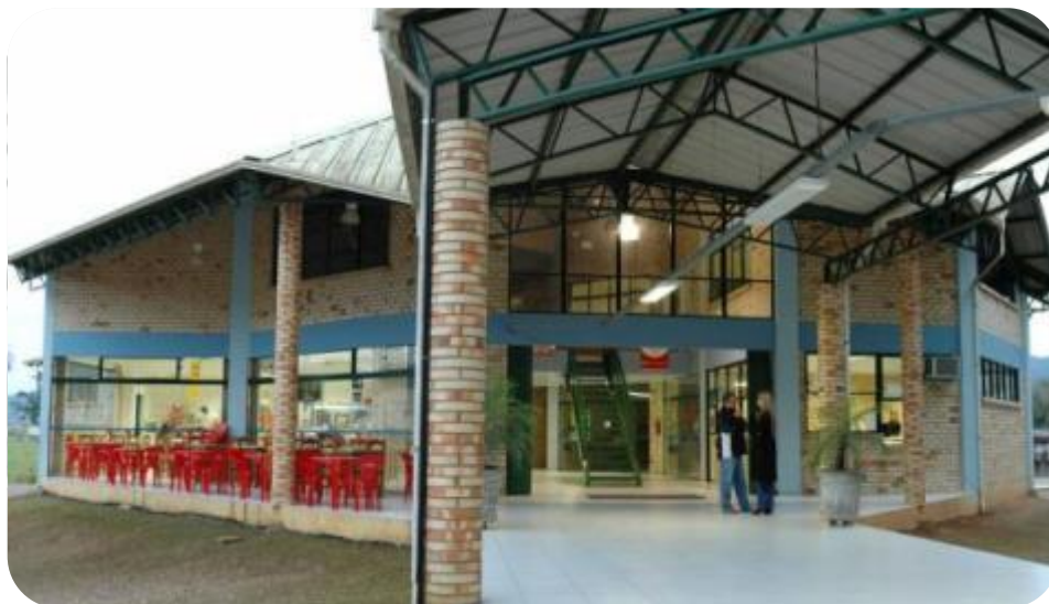
IMAGEM FRONTAL DO CENTRO DE CONVIVÊNCIA – BLOCO B

Em primeiro de agosto de 2002 foi inaugurado o Bloco de Convivência, também conhecido como Bloco B.