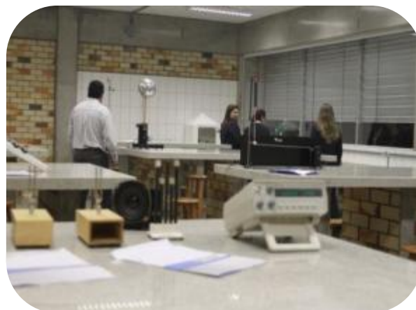
IMAGENS DOS LABORATÓRIOS DO BLOCO D