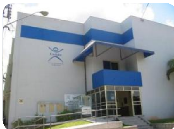
IMAGENS EXTERNAS DO ANFITEATRO DA UNIFEBE

É no prédio do Anfiteatro que são realizadas as cerimônias de Colação de Grau dos cursos de graduação da UNIFEBE e a maioria dos eventos institucionais, promovidos tanto pela IES como pelos acadêmicos. Este prédio, também é bastante utilizado pela comunidade de Brusque na realização de eventos culturais.