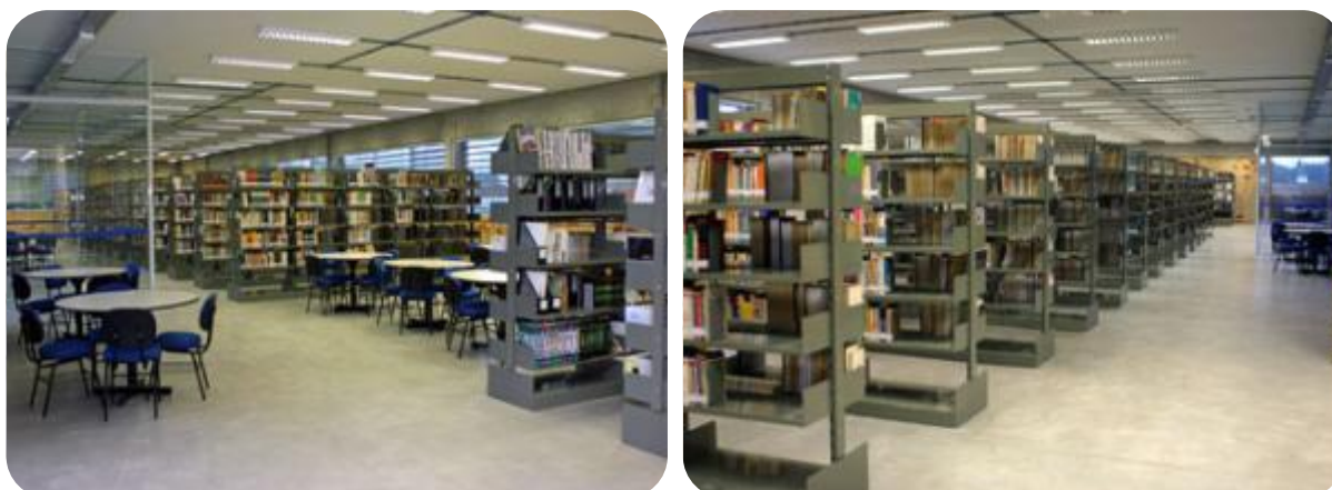
IMAGEM DA BIBLIOTECA ACADÊMICA