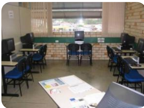
SALA PARA PESQUISA DO LABORATÓRIO III

O Laboratório III é usado exclusivamente para o Curso de Sistemas de Informação. Uma sala anexa a este laboratório, com 5 computadores e um monitor (funcionário) estará à disposição dos acadêmicos, de qualquer curso, para consultas e trabalhos durante o período da noite, de segunda a sexta-feira.