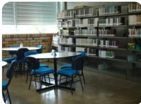
IMAGENS DA SALA DE TRABALHO DOCENTE