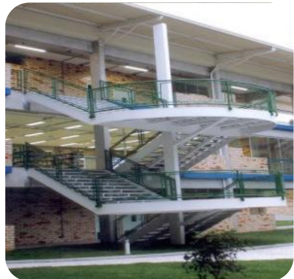
IMAGENS DO BLOCO C

Com uma área construída de 4.363,82 m 2 , o prédio abriga a Biblioteca Acadêmica com 1.077,51 m 2 , um auditório com 153,66 m 2 com capacidade para comportar 130 pessoas e uma sala de desenho, além de 31 (trinta e uma) salas de