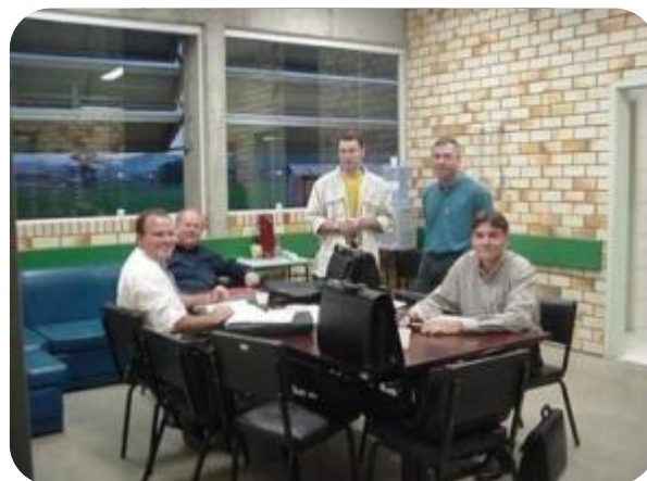
IMAGENS DA SALA DOS PROFESSORES