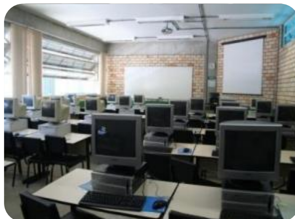
IMAGENS DOS LABORATÓRIOS DE INFORMÁTICA DA UNIFEBE

Em fevereiro de 2013 foi inaugurado o quinto Laboratório de Informática da UNIFEBE com área 56m 2 . Localizado na sala 42 do Bloco A, o Laboratório conta com 26 (vinte e seis) computadores de última geração, equipados com Dell OptiPlex 7010 com processadores Intel Core i7-3770 3ª Geração, 4 GB de RAM DDR3, Placa de Vídeo Radeon 1 GB, HD Sata 500 GB, Monitor 19" Flat Panel. Todos possuem o Sistema Operacional Windows 7 Pro, além de softwares como Office Professional Plus 2010, Libreoffice 3.6, Firefox 18.0.2, 7zip, Adobe Photoshop CS6, Adobe Master Collection (Illustrator CS6, InDesign, Acrobat X Pro, Flash Professional CS6, Flash Builder, Dreamweaver CS6, Fireworks CS6, Adobe Premier CS6).