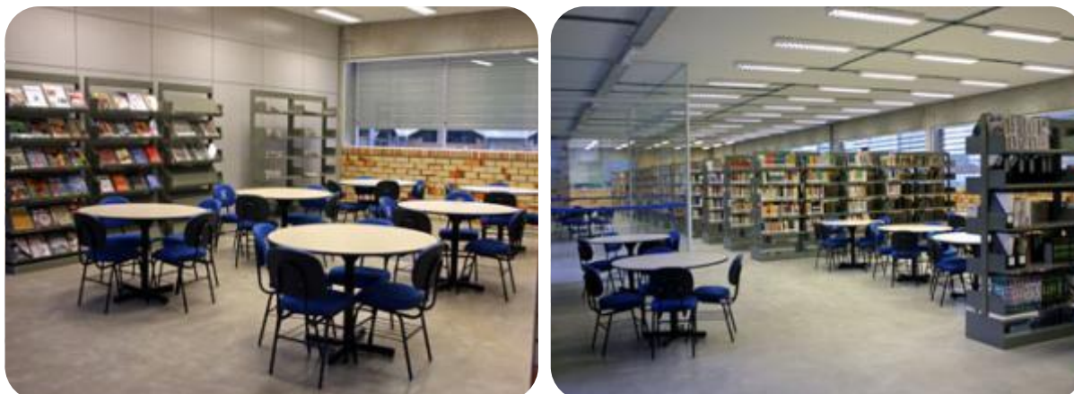
IMAGENS DAS MESAS PARA PESQUISA E LEITURA