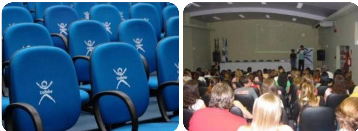
IMAGENS DO AUDITÓRIO DO BLOCO C

aula que são utilizados no período noturno e matutino pelos cursos de graduação e pós-graduação.