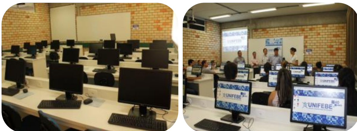
IMAGENS DO LABORATÓRIO DE INFORMÁTICA V

Excetuando-se os horários de aulas, todos estão abertos gratuitamente aos acadêmicos e professores para elaboração de trabalhos escolares, monografias, teses e trabalhos de conclusão de cursos, bem como acesso à navegação na web.