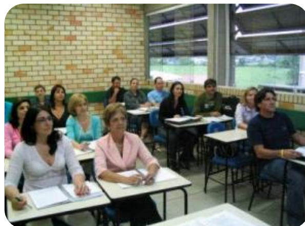
IMAGENS DAS SALAS DE AULA

Ainda nesse mesmo bloco, de 5,4 mil metros quadrados, estão funcionando a Secretaria Acadêmica, o Núcleo de Informática e a Reitoria.