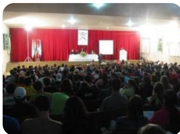
IMAGENS INTERNAS DO ANFITEATRO DA UNIFEBE