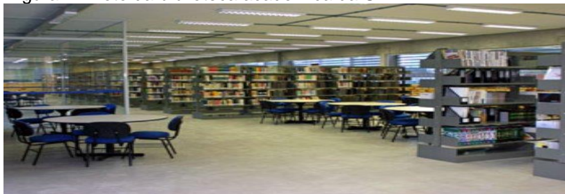
Figura 1 - Foto da biblioteca acadêmica da UNIFEBE